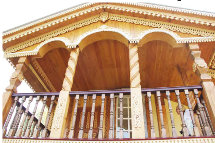
Царское крыльцо - работа современных мастеров-резчиков

За несколько лет собралось немало деревянных