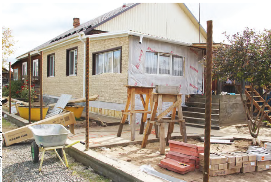
Машуковцы ремонтируют дома